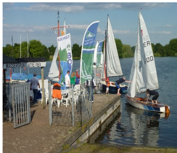
Von der Pike auf – mit Segeljollen

Mindestteilnehmer 7 / Höchstteilnehmer 20